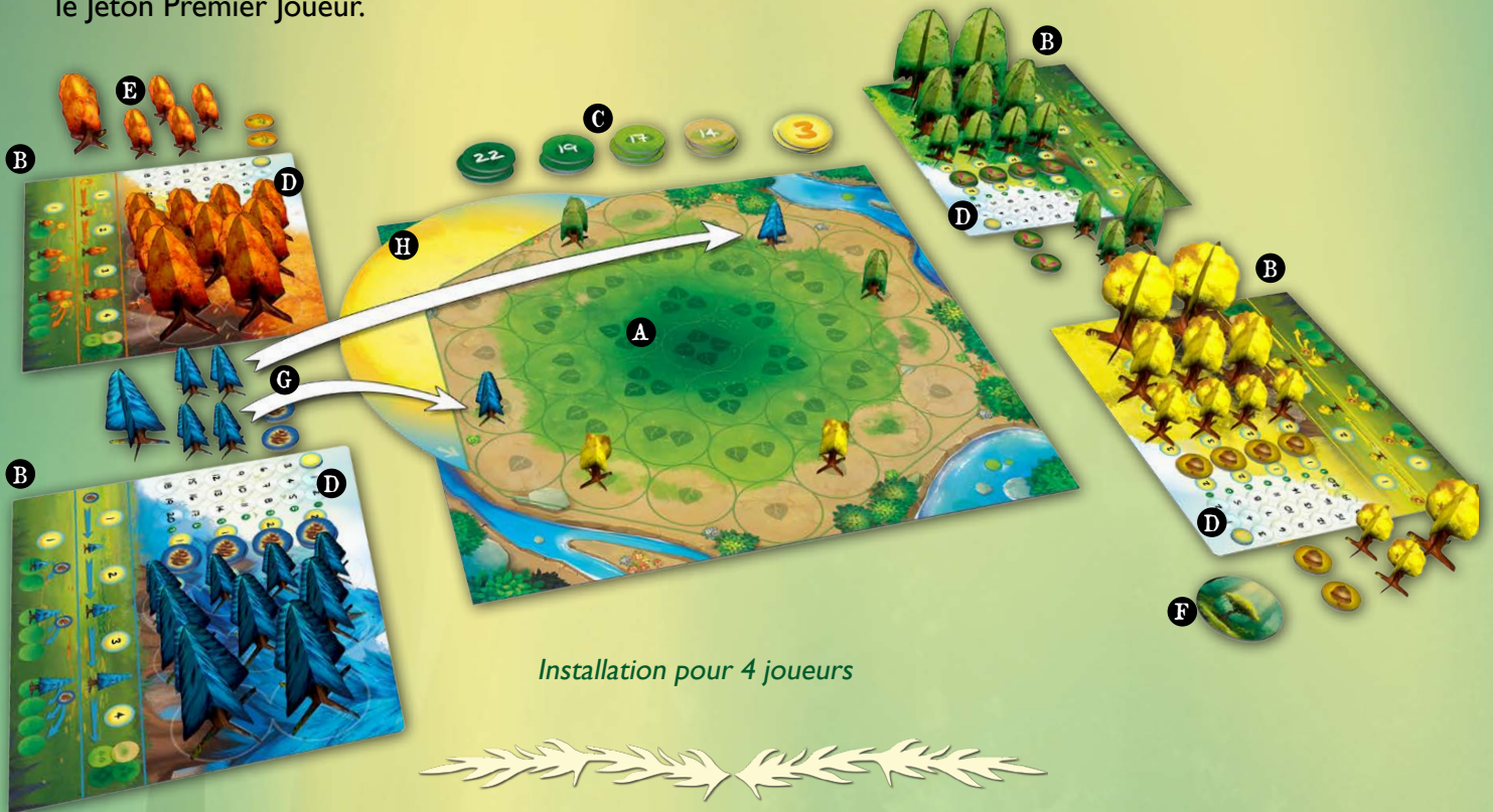
Installation pour 4 joueurs